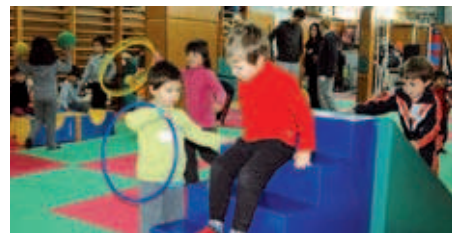
Els més petits fent una de les activitats al Casal Esportiu de la Setmana Blanca

gym i els més petits es van divertir amb jocs d'aigua. Els participants, al voltant d'una trentena amb edats compreses entre els 3 i els 12 anys, van tenir l'oportunitat de fer diverses activitats esportives com psicomotricitat, bàsquet, futbol sala, handbol i un primer apropament al karate i el hip-hop. El primer dia, els inscrits van fer una excursió al Museu Olímpic de Barcelona.