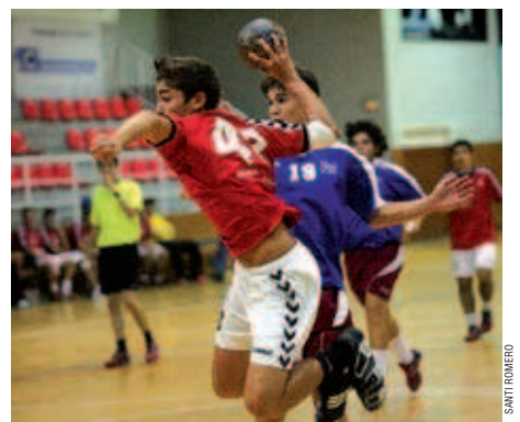
El juvenil de La Salle es troba a la novena posició de la màxima categoria