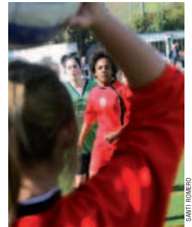
L'equip és al vuitè lloc amb 27 punts