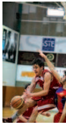
El sots-21 masculí va vencer el Gavà

D'altra banda, l'equip sots-21 femení va aconseguir a la pista de l'Escolapis Sarrià el tercer triomf a la lliga, en guanyar per