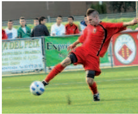
L'equip juvenil de l'EF Montcada es juga bona part de la temporada el dia 19

Grades plenes. La plantilla, conscient de la importància de la victòria, ha fet una crida a l'afició perquè doni suport als jugadors. "Els nois estan molt motivats, serà un matx difícil