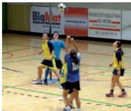
El júnior de l'AE Montserrat Miró ha aconseguit sumar el primer punt

Silvia Alquézar | Redacció L'equip júnior de korfbal de l'Associació Esportiva Montserrat Miró està fent una gran progressió. El conjunt montcadenc està format per jugadors cadets amb experiència i altres en edat júnior que no havien jugat mai a aquest esport. El treball de la plantilla i el cos tècnic està sent intens i difícil per conjuntar tots