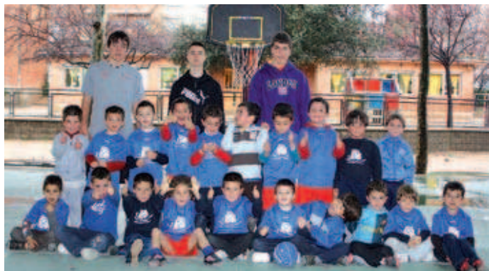
Grup dels nens de P-4 i P-5 de l'escola Elvira Cuyàs, de Mas Rampinyo, que fan multiesport en horari extraescolar

Però, una altra de les propostes que té una bona acollida és el patinatge, que les nenes inscrites participen enguany per primer cop a les compe-