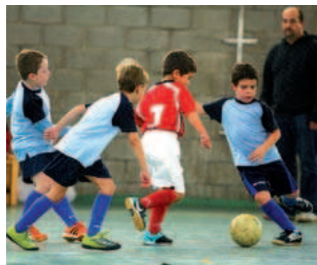
Els més petits del Mause aprenen ràpidament a jugar a futbol sala