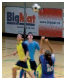
Una jugada del partit amb el Badalona

El Multiópticas Isis A va aconseguir el 13 de març una victòria important contra el CK Badalona per 15 a 11 que li permet continuar a la tercera posició de la Lliga Nacional amb 13 punts, a 3 d'avantatge respecte el segon classificat, el CEVG, el pròxim rival, que ha disputat un partit menys. El conjunt local va fer un bon partit conscient que era vital sumar els dos punts en joc per seguir aspirant a la classificació per