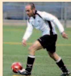
El Santa María és primer amb 53 punts